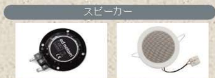
●グラスマウントタイプ ●天井埋込タイプ(参考)