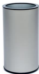
ガンメタル シルバー