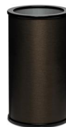
エリート ブロンズ