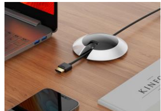
ビデオ再生仕様 (HDMI - HDMIケーブル)