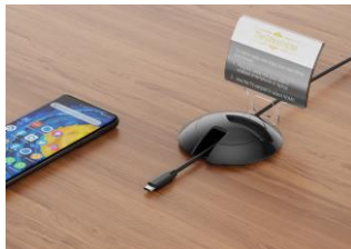
ブラック仕様 (USB-C - HDMIケーブル)