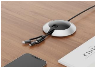
3 in 1 充電仕様 (USB-C, Lightning, Micro USB)