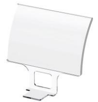
デスクカードホルダー