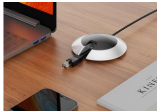
データ転送仕様 (LAN - LANケーブル)